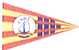
Club Nautique d'Hermance www.c-n-h.ch